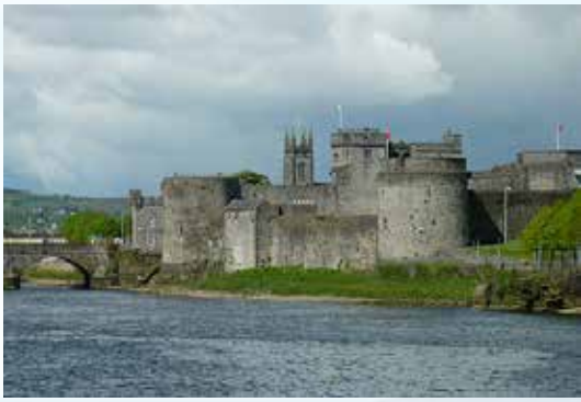
King John's Castle

ral, besuchen Sie das Hunt Museum (beides nicht im Preis enthalten) oder bummeln Sie einfach durch Limerick und nehmen das Flair dieser Stadt am Shannon auf. Übrigens ist Frank McCourt, der Autor von „Der Asche meiner Mutter (Angela's Ashes)“ hier aufgewachsen. Ein kleines Museum in seiner alten Schule erinnert an ihn. Danach geht es zu unserem Hotel in/bei Limerick.