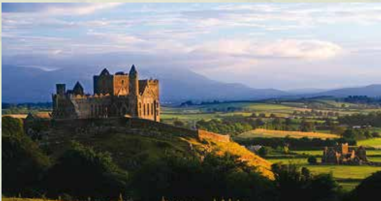
Rock of Cashel