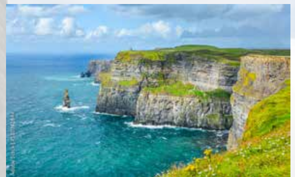
Cliffs of Moher

Durch die faszinierende Landschaft des Burren fahren wir zu den Cliffs of Moher, die um die 200 m hoch aus dem Meer ragen. Bei klarem Wetter sieht man die berühmten Aran Inseln. Dann geht es nach Limerick, wo King John's Castle auf unsere Besichtigung wartet. Im Anschluss können Sie sich im Stadtzentrum frei nach Ihren Vorlieben bewegen. Besichtigen Sie die St. Mary's Cathed-