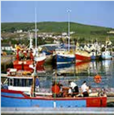
Hafen von Dingle

Unser Weg führt uns nach Südwesten über Tralee auf die Dingle Halbinsel nach Dingle, einem malerischen Fischerort. Nachdem wir uns Dingle angesehen haben, geht es über den berühmten „Slea Head Drive“, die wohl schönste und spektakulärste Küstenstraße Irlands. Diese führt uns zum westlichsten Punkt Europas, Slea Head. Später erreichen wir das Gallarus Oratory, ein Kirchlein aus dem Ende des 8. Jahrhunderts. Die Rundfahrt endet wieder in Dingle und wir setzen unsere Fahrt zu unserem nächsten Ziel Killarney fort. Wir machen sicher Halt am gigantischen Strand von Inch, und sie können zumindest die Füße im Atlantik baden. Über Castlemaine geht es dann schließlich nach Killarney zu unserem Hotel. (3 Übernachtungen in Killarney).