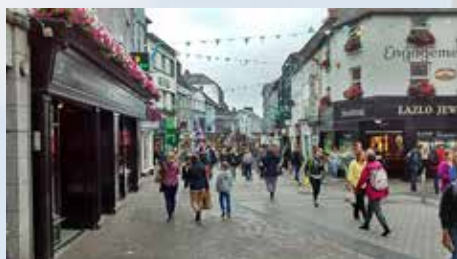
Galway, William Street

Nach dem Frühstück laden wir unser Gepäck ein und starten eine längere Fahrt, die uns an die Westküste Irlands nach Galway führt. Wir erkunden das Stadtzentrum dieser jungen von vielen Studenten geprägten Stadt. Nach der Stadterkundung machen wir uns auf den relativ kurzen Weg zum Hotel, wo wir eine Nacht bleiben.